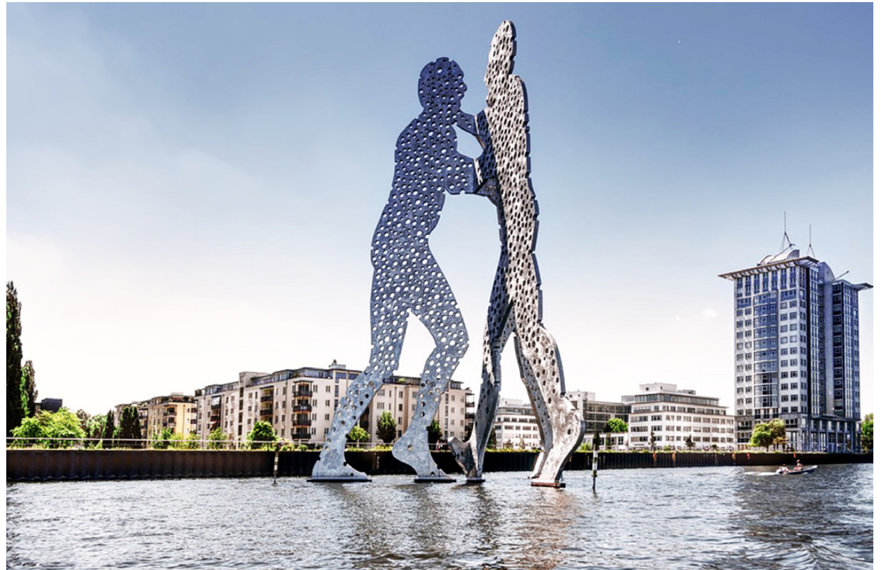
In der Nähe der Treptowers entsteht unter anderem ein neues Wohnquartier.

Mit dem Projekt Hotel und Wohnen an der Spree haben wir uns als CDU-Fraktion Treptow-Köpenick für ein Projekt gelungener Stadtplanung eingesetzt. Geplant sind hier zwei Wohntürme (90 m und 110 m) sowie ein 60 Meter hoher Hotelurm mit um die 200 Zimmer und ein öffentliches Restaurant. Gebaut wird in der Fanny-Zobel-Straße zwischen dem Treptowers-Areal mit dem Allianzurm auf der einen Seite und der Arena-Treptow auf der anderen Seite. Diese Mischung aus Wohnen und Hotel ergänzt das Areal und schließt eine Lücke am Uferstreifen der alten Industrietrache. Der Mehrwert für Alt-Trep-